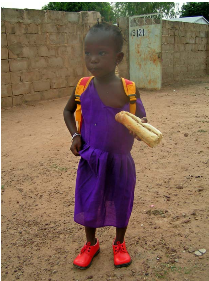
Bilden är från 2004 och talar för sig själv. En lycklig flicka på väg till skolan med sin nya skolväska och skor.