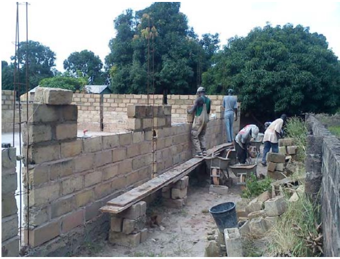
Nu var det dags att använda cementblocken. Efter bara några veckor var ytterväggarna klara!