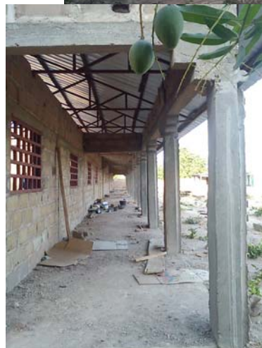
Takstolar på plats, fönster isatta. Nu börjar det likna en riktig skola! Nu ska alla väggar putsas och målas. Därefter är det el arbetet kvar. När ni läser detta är förhoppningsvis skolan i det närmaste klar.