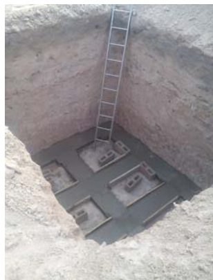
påbörjade Hamadi bygget med de nya toaletterna. Det är ett hårt arbete att hacka sig ner 4 meter. Detta arbete görs av byfolket som lovat att hjälpa till med grävningsarbetet.