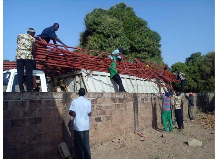
Takstolarna som tillverkades vid kusten och transporterats de 40 milen till Basse har anlänt. Nu var det dags för ett tungt arbete. Som de flesta arbetsmomenten på detta bygge så är det handkraft som gäller då det inte finns maskiner till hjälp.