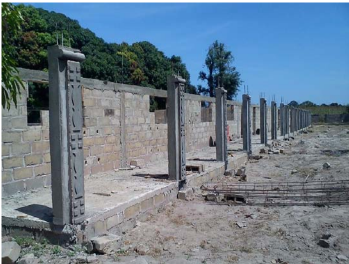
Pelarna till verandan och som bl.a. ska hålla uppe taket var nästa jobb. Vi blev imponerade när vi såg dessa konstverk. I väntan på takstolarna