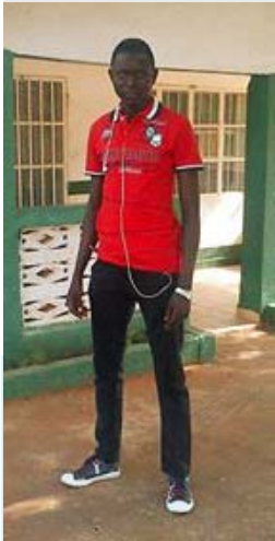
Jobbar på Ministry of health