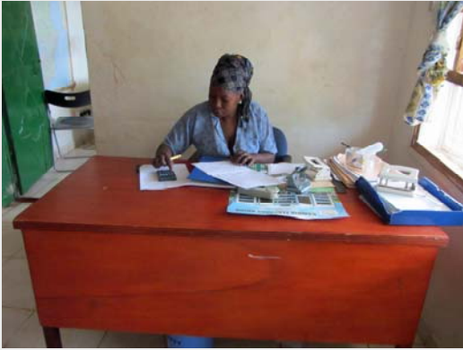
Binta som jobbar på kontoret