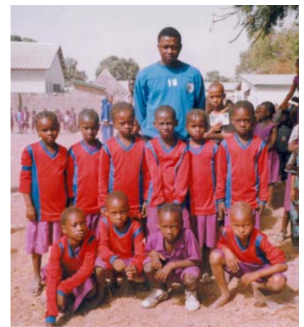
Mansajang Sport Team