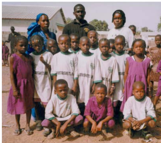
Manneh Kunda Sport Team