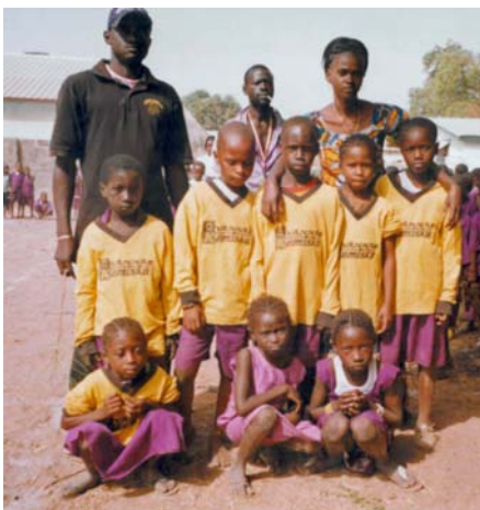
Kaba Kama Sport Team