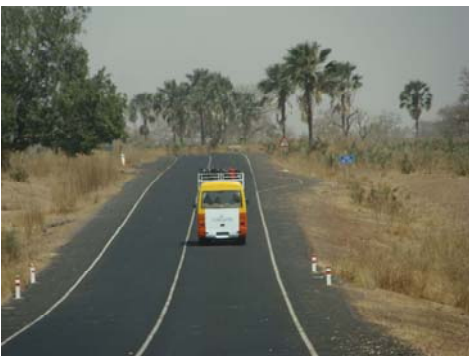
Två sådana här bussar åkte vi.

Hela familjen satt förväntansfulla i bussen, annorlunda natur, enorm värme, kor, åsnor och getter på vägarna. Människorna