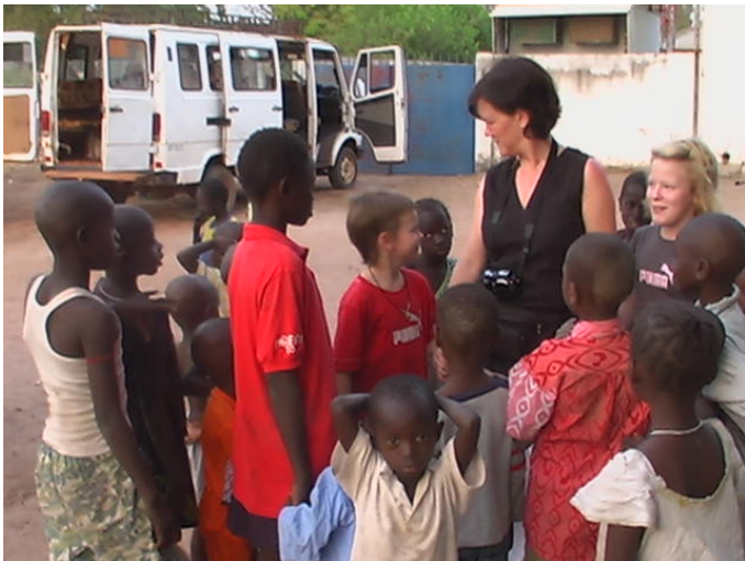
Det är inte svårt att få vänner i Gambia

Det var mycket vackert och intressant. Innan lunch åkte vi mot nästa camp, Sindola Camp som ligger i byn Kanilai där presidenten är född. Det var en camp helt olik de andra camperna vi varit på. Den här campen var lyxig och höll hög standard. Vi som var fyra stycken fick sviten på campen, men tro inte att allt fungerade för det – men det mesta. Vi åt lunch och tillbringade eftermiddagen vid poolen. På kvällen gick vi en runda i byn och hade byninvånare som höll oss i händerna och var nyfikna på oss.