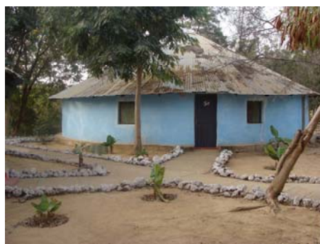
Så här bodde vi på Fullado camp

Efter sex timmar på Gambiafloden anlände vi till Basse och checkade in på Fulladu camp.